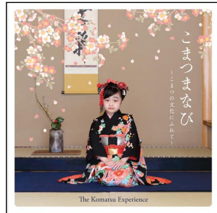
【優秀賞】石川県小松市